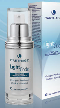
Complejo Despigmentante x 30g

Corrige - Previene - Unifica - Ilumina. Cuidado específico para el tratamiento de las hiperpigmentaciones y el fotoenvejecimiento. Unifica de manera excepcional el tono y la textura cutánea dejando el cutis uniforme y luminoso.