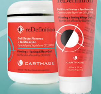
Gel Efecto Firmeza + Tonificación x 200ml y 500ml

Tratamiento reafirmante y tonificante. Combate la celulitis, estimula la microcirculación y mejora el aspecto de la piel "de naranja". Apto aparatología.