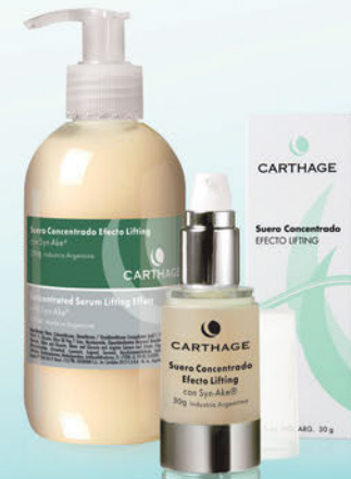
Suero Concentrado Efecto Lifting x 30g y 250g

Con el exclusivo activo Synake® a base de veneno de víbora, permite la relajación de las contracciones del músculo facial dando como resultado una piel lisa.