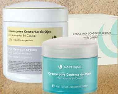
Crema para Contorno de Ojos x 30g y 250g

Productos de lujo a base del exquisito caviar, que aceleran la regeneración cutánea para devolverle vitalidad y lozanía a la piel.