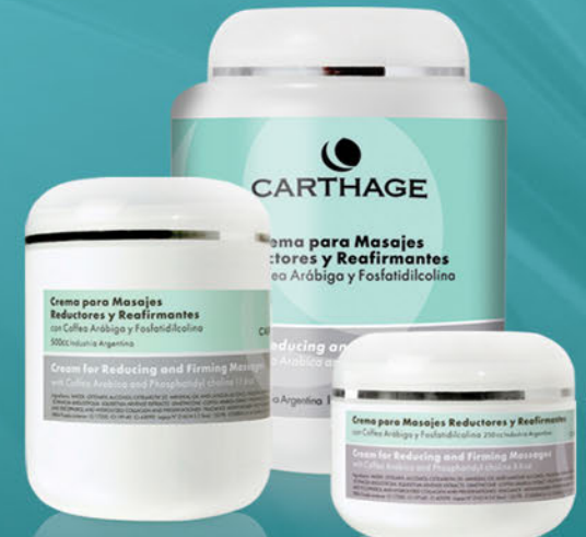
Crema para Masajes Reductores y Reafirmantes x 250cc. y 500cc.

Trata la obesidad localizada, mejora la apariencia de la piel con celulitis, combate la flacidez y favorece el drenaje.