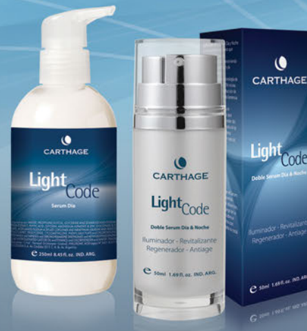
Doble Serum Día y Noche x 50ml Serum Día x 250ml

Una combinación de principios activos de vanguardia especialmente seleccionados para revelar la luz de una piel joven, uniforme y perfecta.