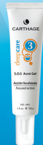
S.O.S. Acné Gel x 30g

Actúa en forma localizada eliminando y previniendo la formación de acné. Sus propiedades astringentes, antisépticas, calmantes y cicatrizantes reducen las impurezas de los poros.