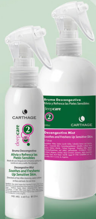
Bruma Descongestiva x 125cc. y 500cc.

Calma, relaja y reequilibra la piel aportándole la hidratación necesaria.