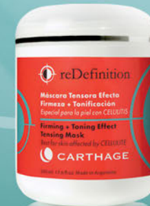
Máscara Tensora Efecto Firmeza + Tonificación x 500ml

Tratamiento reafirmante, tensor y drenante. Ayuda a eliminar la celulitis más rebelde, estimula la circulación y potencia la producción de colágeno recuperando la elasticidad y el tono.