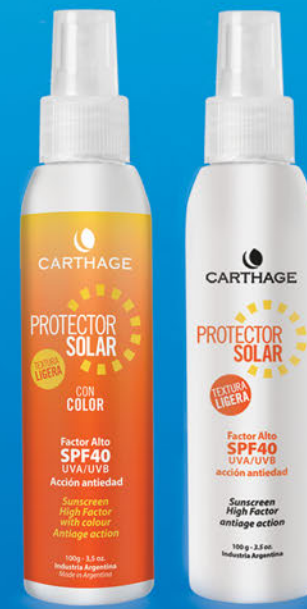
Protector Solar Factor Alto SPF 40 Textura Ligera x 100ml CON y SIN COLOR

Protector solar de acción antiedad que facilita un bronceado uniforme y seguro. Su textura ligera es ideal para pieles normales y grasas.