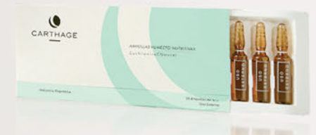
Ampollas Humecto-Nutritivas con Vitamina C x 10 unidades de 3cc.

Concentrado de acción antioxidante y energizante celular, aporta a la piel hidratación y nutrición. Apto aparatología.