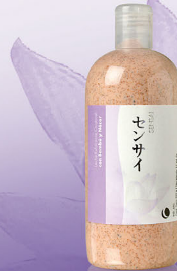
Leche Exfoliante Corporal x 500g

Exfolia, limpia y purifica profundamente la piel dejándola suave y revitalizada. Estimula el proceso de renovación celular.