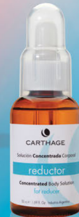
Concentrado Reductor x 50cc.

Tratamiento para las adiposidades resistentes.