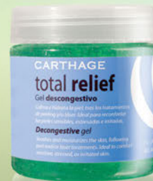
Total Relief Gel Descongectivo x 200g

Una exfoliación gradual con resultados óptimos para cada tipo de lesiones cutáneas.