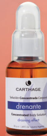
Concentrado Drenante x 50cc.

Tratamiento para la celulitis y disfunciones circulatorias.