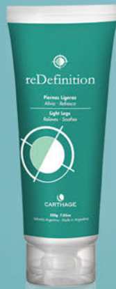
Gel Piernas Ligeras x 200ml

Un programa completo y eficaz que realiza cuatro acciones simultáneas: reduce el contorno corporal, promueve el drenaje disminuyendo la retención de líquidos, reafirma la piel y combate la celulitis rebelde mejorando su aspecto.