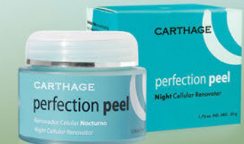
Perfection Peel Renovador Celular Nocturno x 50g

Activa los mecanismos de reparación de la piel durante la noche. Imita el proceso de descamación natural, obteniendo una piel más tersa, luminosa e hidratada. Intensifica, acelera y maximiza el resultado del peeling.