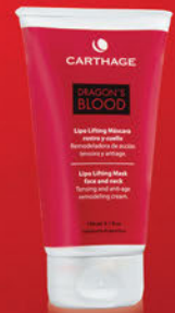
Lipo Lifting Máscara Rostro y Cuello x 150g

Tratamiento de triple acción: antiage, reafirmante y reestructurante. Remodela la zona del óvalo facial consiguiendo un verdadero efecto antigravedad.