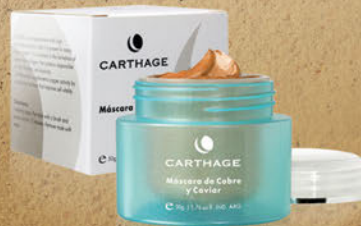
Máscara de Cobre y Caviar x 50g

Con su alto poder antioxidante, aporta firmeza y elasticidad a la piel, acelerando la regeneración cutánea para obtener una piel rejuvenecida.