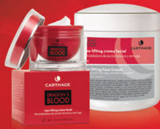
Lipo Lifting Crema Facial x 50g y 250g

Crema de acción correctiva, eleva los rasgos del óvalo facial gracias a su poder reafirmante y reestructurante. Reduce la flacidez y aumenta la elasticidad protegiendo y fortaleciendo las fibras de colágeno.