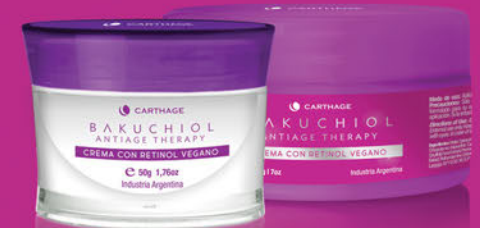
ANTIAGE THERAPY Crema con Retinol Vegano x 50g y 200g

Crema con una combinación única de ingredientes naturales que rejuvenecen la apariencia del rostro. Combate los signos visibles del envejecimiento cutáneo para un efecto anti-edad total: reduce arrugas, recupera la firmeza, combate las manchas, unifica el tono, hidrata, regenera y aporta luminosidad. Posee potentes antioxidantes que neutralizan los radicales libres y el estrés oxidativo. Revitaliza el cutis para lucir una piel tersa, luminosa y radiante.