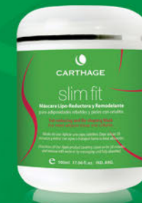
Máscara Lipo-Reductora y Remodelante x 500ml

Tratamiento que redefine el contorno corporal y combate las adiposidades rebeldes.