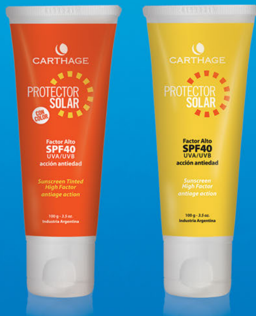
Protector Solar Factor Alto SPF 40 x 100g CON y SIN COLOR

Emulsión protectora solar de acción antiedad que facilita un bronceado uniforme y seguro. Su fórmula dermatológicamente testada proporciona una equilibrada protección de alto espectro UVA / UVB, previene el envejecimiento prematuro y la aparición de arrugas y manchas.