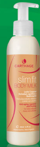
Slim Fit Body Milk x 200g

Leche corporal antiedad, de acción lipolítica, reafirmante y anticelulítica. Combate los signos del paso del tiempo, para lograr una silueta joven, firme y esbelta.