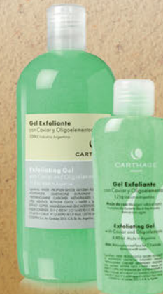
Gel Exfoliante x 125g y 500g

Contiene partículas acrílicas y siliconadas que eliminan las impurezas y células muertas dejando la piel suave y aterciopelada.