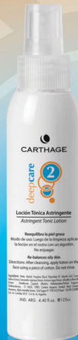
Loción Tónica Astringente x 125cc.

Reduce el tamaño de los poros y controla la oleosidad de la piel dejándola fresca y limpia.