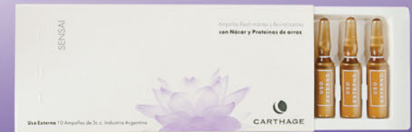
Ampollas Reafirmantes y Revitalizantes x 10u de 3cc.

Antioxidante natural con efecto reestructurante e hidratante. Su textura aterciopelada brinda una delicada sensación de suavidad.