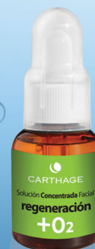
Solución Concentrada Facial Regeneración + O2 x 25cc.

Tratamiento activador de la oxigenación para pieles desvitalizadas.