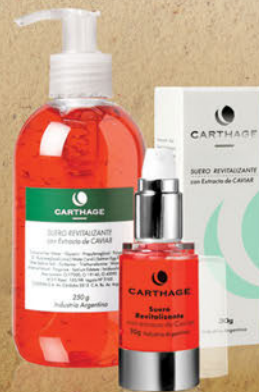
Suero Revitalizante x 30g y 250g

Regenera las células ofreciendo una acción reafirmante, hidratante y tonificante. Apto aparatología.