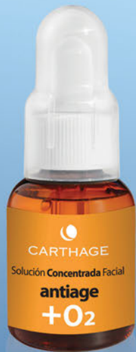
Solución Concentrada Facial Antiage + O2 x 25cc.

Activan la oxigenación de la piel, hidratan, combaten el envejecimiento prematuro y la protegen del estrés ambiental. Apto aparatología y combinables con los productos Carthage.