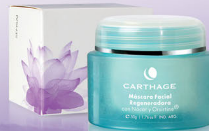
Máscara Facial Regeneradora con Nácar x 50g

Una línea cosmética sensorial inspirada en la filosofía ancestral de oriente que prioriza el equilibrio entre mente y cuerpo. Aromas y texturas que logran despertar nuestros sentidos, activándonos y relajándonos al mismo tiempo.