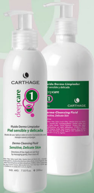
Fluido Dermo-Limpiador x 200cc. y 500cc.

Programa de tratamiento antiedad y reparador que estimula los mecanismos de defensa y alivia la inflamación, disminuyendo las rojeces y otorgando calma y máximo confort a la piel.