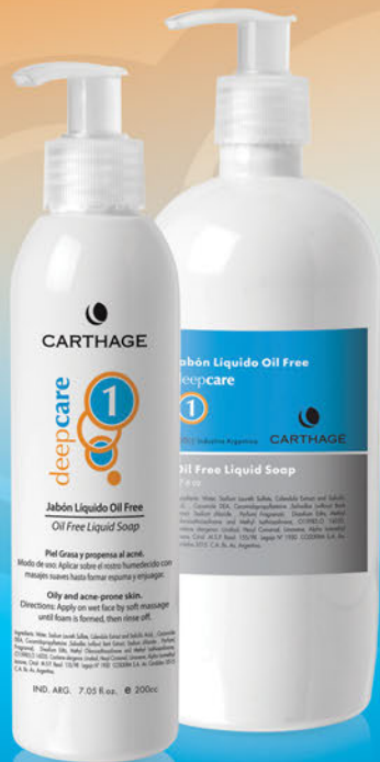
Jabón Líquido Oil Free x 200cc. y 500cc.

Programa de tratamiento para prevenir y combatir el acné en pieles grasas o mixtas.