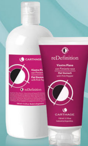
Vientre Plano x 150gr y 500g

Tratamiento intensivo para reducir el exceso de adiposidad acumulada en el abdomen. Drena y reafirma la piel flácida hasta recuperar el tono y las formas atractivas.