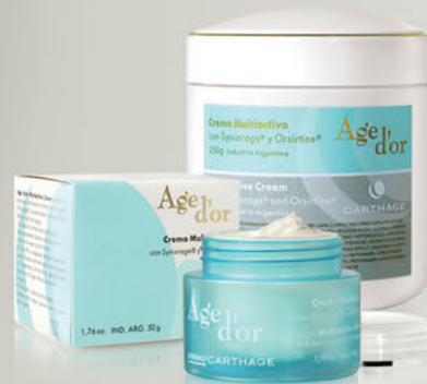
Crema Multiactiva Age D'or x 50g y 250g

Una combinación de fórmulas únicas capaces de desacelerar el paso del tiempo.