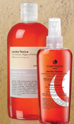
Loción Tónica x 125g y 500g

Tonifica, suaviza e hidrata la piel, restaurando su pH natural.