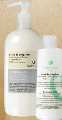
Leche de Limpieza x 200g y 500g

Remueve profundamente las impurezas y el maquillaje sin modificar el balance fisiológico de la piel. Hidrata y tonifica.