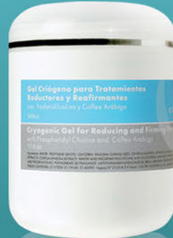
Gel Criógeno para Tratamientos Reductores y Reafirmantes x 500cc.

Gel frío especialmente formulado para problemas circulatorios. Disminuye la celulitis y las grasas localizadas. Con acción reafirmante.