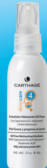
Emulsión Hidratante Oil Free x 60g

Regula la secreción sebácea evitando la dilatación de los poros y el brillo propio de la piel grasa. Hidrata y mantiene su equilibrio.