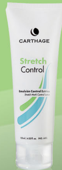
Stretch Control Emulsión Control Estrías x 120ml

Emulsión regeneradora y nutritiva que previene y atenúa el aspecto de las estrías recientes otorgando tonicidad y elasticidad a la piel.