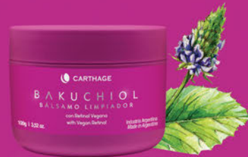
BÁLSAMO LIMPIADOR con Retinol Vegano x 100g

Elimina en profundidad las impurezas, polución, y el maquillaje, incluso el resistente al agua, sin alterar la barrera cutánea. Gracias a sus componentes con Bakuchiol, Aceite de Coco, Aceite de Jojoba y Manteca de Karité nutre e hidrata; su textura sólida se funde al entrar en contacto con la piel dejándola suave y equilibrada.