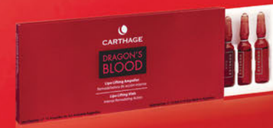
Lipo Lifting Ampollas x 10 u de 3cc.

Tratamiento de potente acción correctiva, tensora y antiage para arrugas profundas y pérdida de firmeza. Combate eficazmente la flacidez y remodela el volumen del contorno óvalo facial, cuello y mentón.