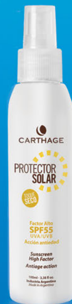
SPRAY Protector Solar Factor Alto SPF 55 Toque Seco x100ml

Protector solar spray transparente, toque seco de acción antiedad que facilita un bronceado uniforme y seguro. Previene el envejecimiento prematuro y la aparición de arrugas y manchas. Su textura fresca y de rápida absorción es ideal para pieles grasas, mixtas, normales y sensibles.