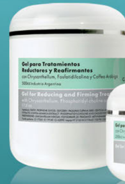
Gel para Tratamientos Reductores y Reafirmantes x 250cc. y 500cc.

Con acción lipolítica, reafirmante y anticelulítica. Apto aparatología.