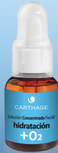
Solución Concentrada Facial Hidratación + O2 x 25cc.

Tratamiento activador de la oxigenación para hidratación profunda.