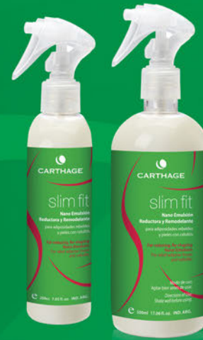
Nano Emulsión Reductora y Remodelante x 200ml y 500ml

Programa corporal que combate las adiposidades más rebeldes basado en el exclusivo activo Drosera Ramentecea liposomada , que "devora" la grasa más rebelde modelando la figura y devolviéndole al cuerpo su forma y armonía.