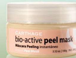
Bio-Active Peel Mask Máscara Peeling Instantáneo x 100g

Máscara pre-peeling y de limpieza profunda. Combina los efectos del peeling enzimático y AHAS. Facilita la extracción de comedones y elimina impurezas y células muertas favoreciendo la renovación de la piel.