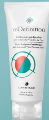
Gel Crema Lipo-Escultor x 200ml

Modela el contorno del cuerpo, combate la adiposidad localizada, corrige el aspecto de la piel con celulitis y posee efecto drenante.