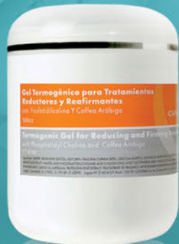
Gel Termogénico para Tratamientos Reductores y Reafirmantes x 500cc.

Productos potenciados contra la celulitis y la obesidad localizada. Estimulan la actividad lipolítica, combaten la flacidez y favorecen el drenaje de los líquidos retenidos en los tejidos. Mejoran la microcirculación aportando firmeza y tonificación a la piel.