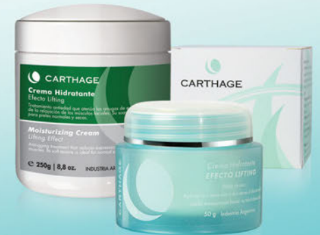
Crema Hidratante Efecto Lifting x 50g y 250g

Tratamiento antiedad que atenúa las arrugas de expresión a través de la relajación de los músculos faciales. Su suave textura es ideal para pieles normales y secas.