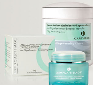
Crema Antienvejecimiento y Regeneradora x 50g y 250g

Promueve la regeneración celular, mejorando la apariencia de los primeros signos de la edad.