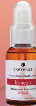
Concentrado Firmeza x 50cc.

Tratamiento para la flacidez persistente.