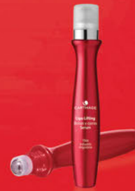
Lipo Lifting Bolsas y Ojeras Serum x 15cc.

Acción drenante y correctora. Reafirma, descongiona y reduce las bolsas minimizando las ojeras y arrugas.